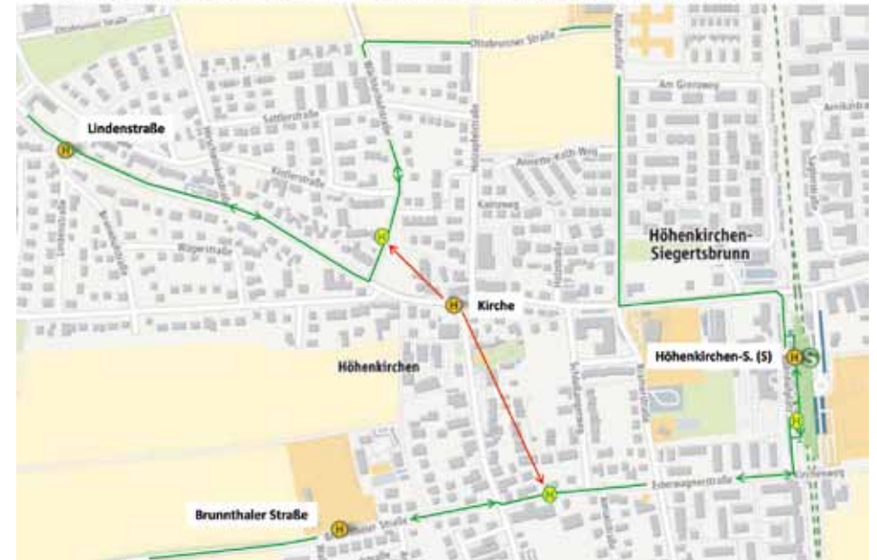
Umleitungsstrecke L.216/244 in Höhenkirchen-Siegersbrunn 29.07.-18.08.2019