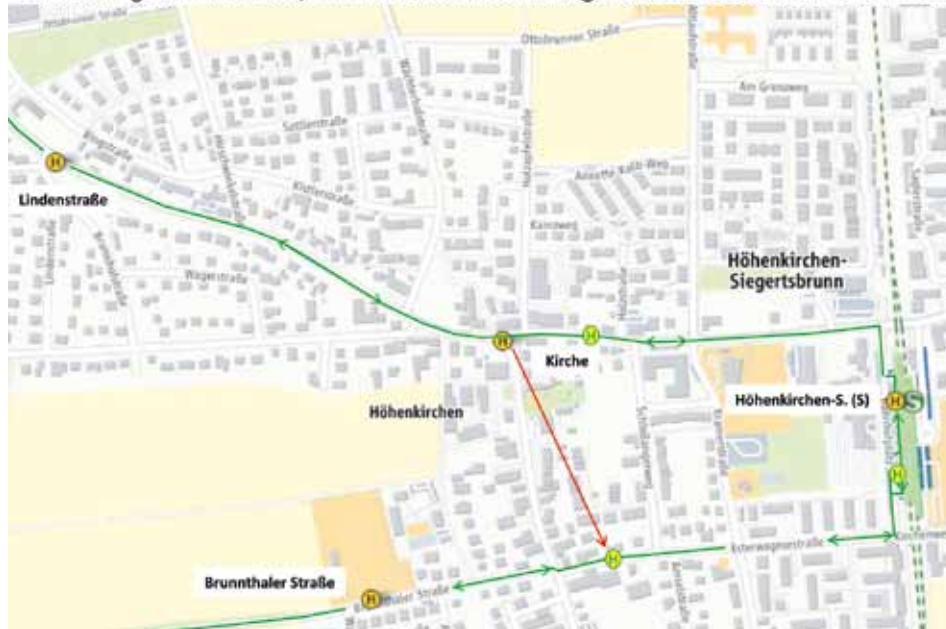
Umleitungsstrecke L.216/244 in Höhenkirchen-Siegersbrunn 19.08.-04.10.2019